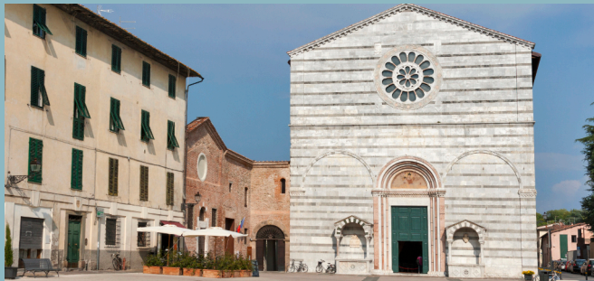
Chiesa di San Francesco

Proseguendo nel centro storico della città di Lucca, incontriamo uno dei suoi complessi monumentali più belli e prestigiosi, il Real Collegio , sede dell'antico convento della basilica di San Frediano e location della Cena di Gala , che avrà luogo la sera del primo giorno del convegno.