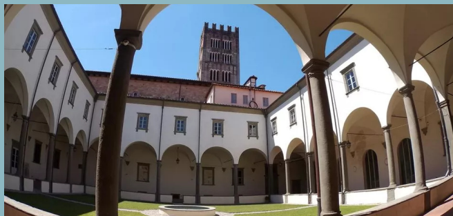
Chiostro Real Collegio COME ARRIVARE

In auto: Percorrere la A11 fino all'uscita Lucca Est. Una volta arrivati a Lucca continuare sulla SS12 radd/Viale Europa e successivamente sulla SS439 in direzione Via Elisa. Una volta entrati da Porta Elisa, percorrere Via dei Bacchettoni fino a Parcheggio Mazzini.